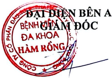
Lê Thị Thủy

- Hợp đồng này được ký kết tại Bệnh viện đa khoa Hàm Rồng, được lập thành 04 bản có giá trị pháp lý như nhau, mỗi bên giữ 02 bản để căn cứ thực hiện